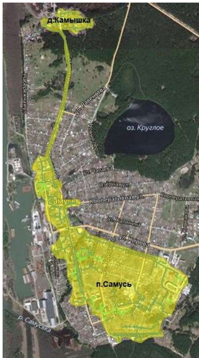
Рисунок 1 – Расширение зоны действия котельной п. Самусь