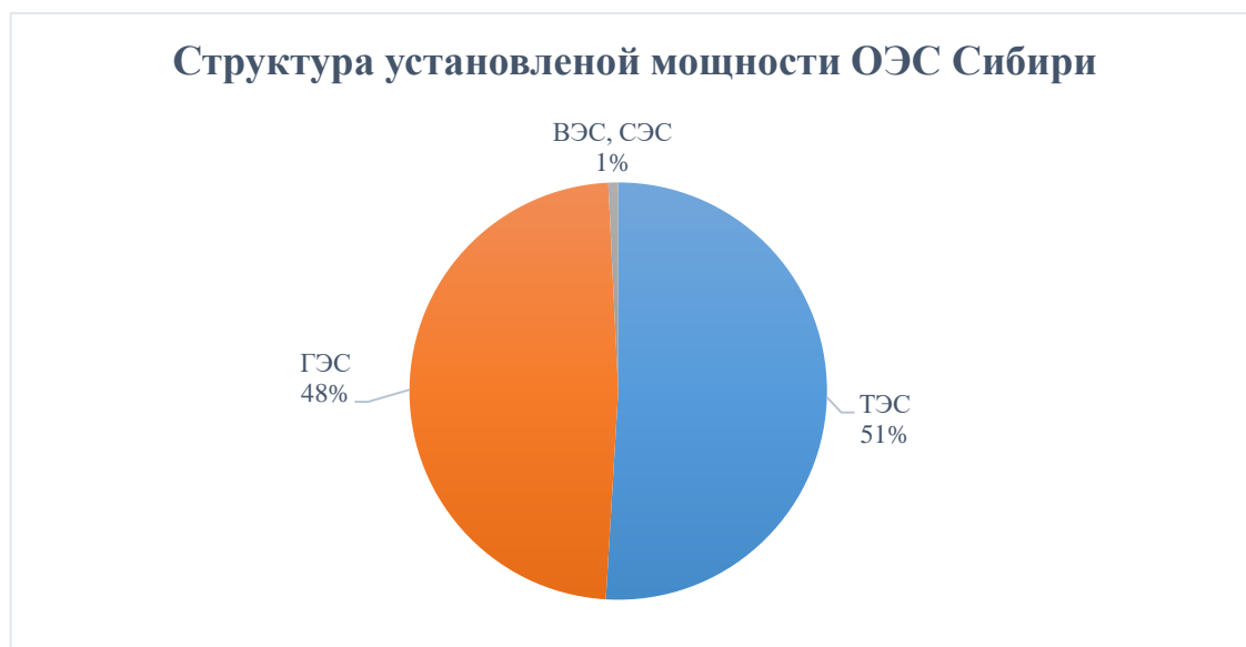
Рисунок 3 – Структура установленной мощности электростанций ОЭС Сибири

Суммарная установленная мощность электростанций ОЭС Сибири составляет 52 489,6 МВт, при этом анализ ретроспективных балансов показывает наличие профицита электроэнергии (положительное сальдо перетоков). Структура установленной мощности ОЭС Сибири показана на рис. 3. Видно, что почти половина установленной мощности приходится на ГЭС, а в 2027 году на площадке АО «СХК» будет введен в эксплуатацию энергоблок Брест-ОД-300 мощностью 300 МВт (СиПР ЭЭС России на 2023–2028 гг, утв. приказом Минэнерго № 108 от 28.02.2023 г.), при этом себестоимость производства электроэнергии на ГЭС и АЭС кратно ниже этого показателя для ТЭЦ.