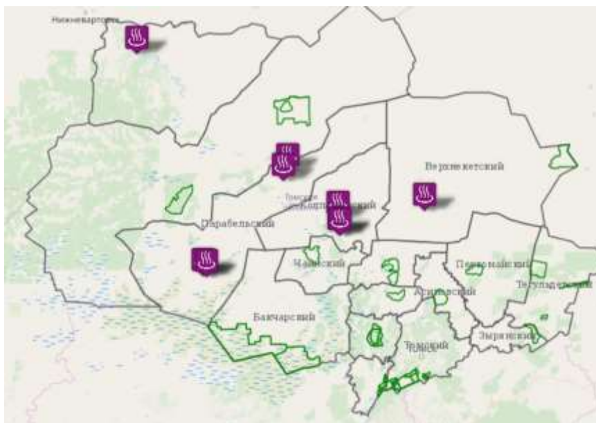
Рисунок 3 – География разведанных запасов геотермальных ресурсов Томской области

Из таблицы 6 видно, что разведанные месторождения термальных вод на территории Томской области имеют значительный потенциал (по температуре энергоресурсы относятся к термальным и высокотермальным водам, по дебиту – к мало- и среднедебитным). Анализ рис. 3 позволяет сделать вывод о том, что месторождения термальных вод сосредоточены, преимущественно, на северо-западе Томской области. Однако несмотря на удаленность месторождений от ЗАТО Северск сохраняется потенциал использования геотермальной энергии для теплоснабжения отдельных объектов, в частности, детский садов или школ (имеется опыт использования таких источников энергии для теплоснабжения детских дошкольных учреждений на территории Томского района).