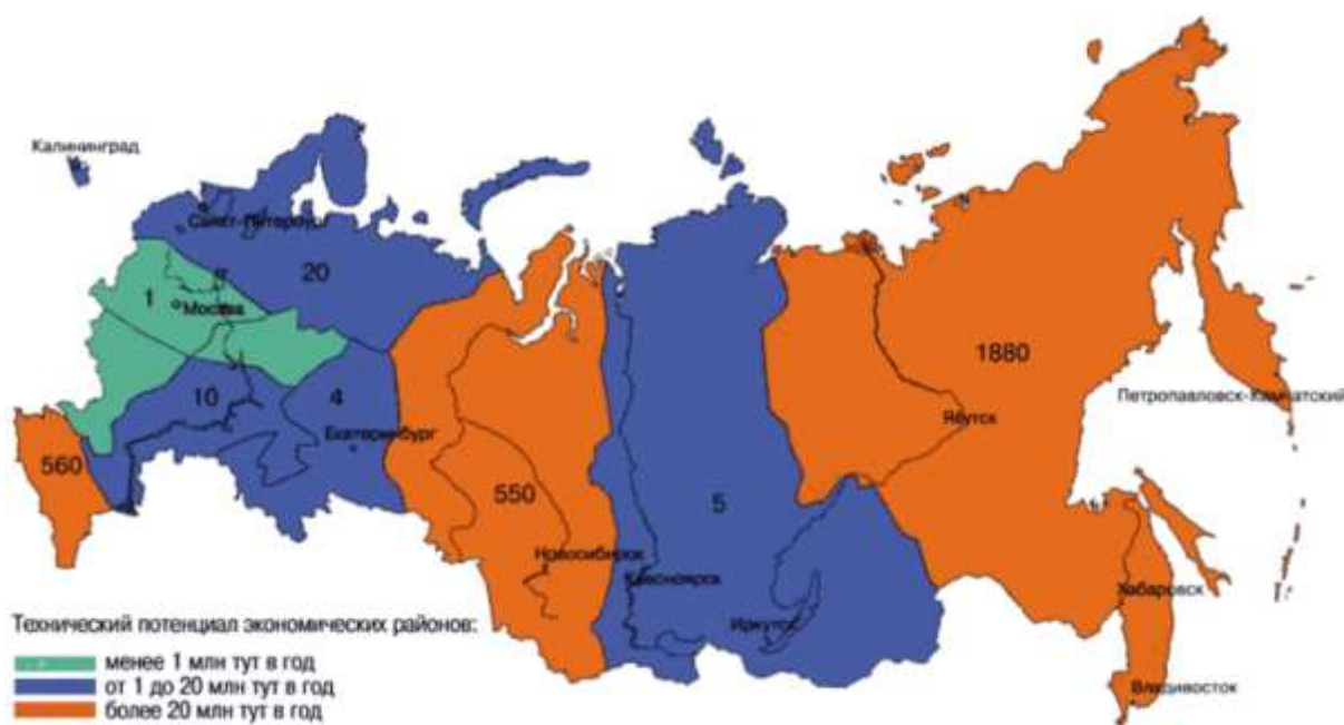
Рисунок 2 – Потенциал геотермальных энергоресурсов

Использование тепла Земли максимально эффективно на территориях с наличием геотермальных вод сравнительно неглубокого залегания. В процессе геологоразведки при поиске нефтяных и газовых месторождений на территории Томской области обнаружены геотермальные энергоресурсы на доступной глубине (1–4 км). Согласно опубликованным данным на территории Западной Сибири сосредоточены значительные запасы геотермальных энергоресурсов (рис. 2).